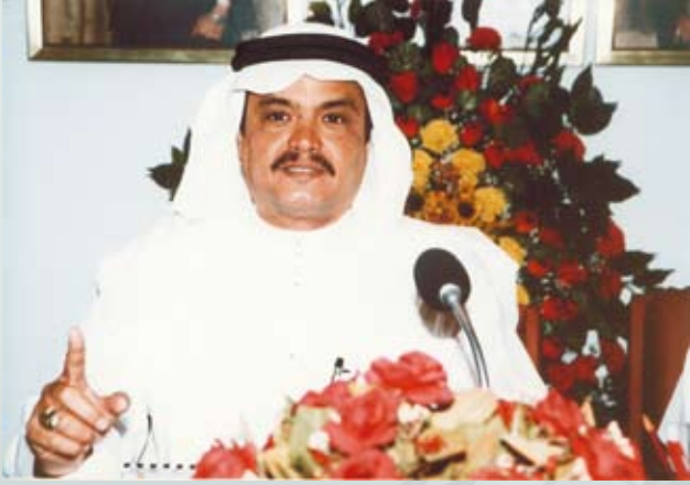
د. بنتن: استيعاب التحديات الراهنة في سوق البريد