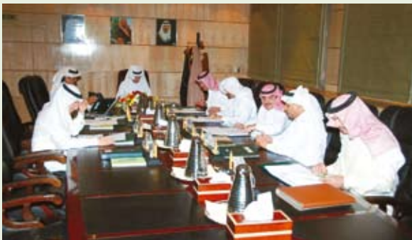
SP Board Of Directors at session