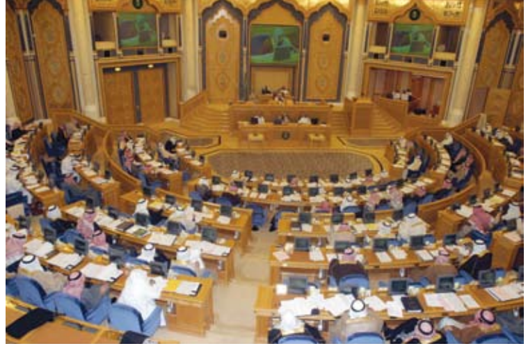
مجلس الشورى السعودي

وقد أشاد أعضاء اللجنة بالمنهجيات، والاستراتيجيات، والبرامج الطموحة للبريد السعودي التي تنعكس إيجاباً على صناعة البريد في المملكة. كما عبر معالي الدكتور بنتن عن سعادته بزيارة لجنة النقل والاتصالات، متمنياً أن تتواصل هذه الزيارات بين المجلس والبريد السعودي.