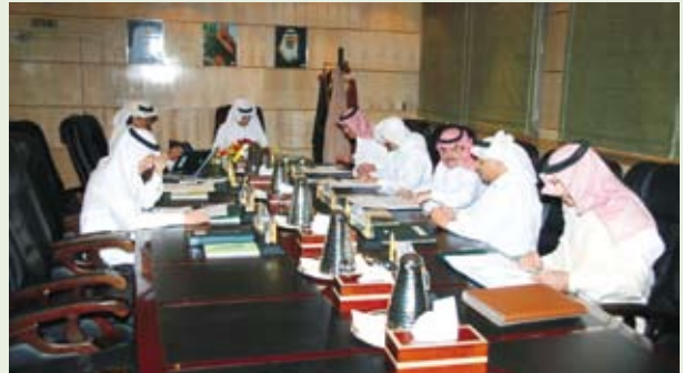
جانب من اجتماع مجلس الإدارة

وناقش الاجتماع عدداً من الموضوعات المدرجة في جدول الأعمال كالاستراتيجية العامة للمؤسسة، وسير المشاريع المنفذة، والبرامج والإنجازات التي تحققت، إلى جانب الموافقة على عدة قرارات وتوصيات لتدعيم تطور العمل البريدي وفق ما هو مدرج في جدول الأعمال.