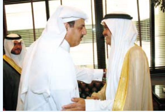
سمو الأمين: خدمات البريد تمثل قفزة كبيرة

وبيّن سموه أن انتشار العناوين البريدية الجديدة يساعد الأمانة في عملها، وهو تكملة للجهد الذي تبذله الأمانة في عملية عنونة الأحياء والمناطق وتسميتها. وكانت مؤسسة البريد السعودي قد أبرمت اتفاقية سابقة مع أمانة مكة المكرمة ومدينة جدة وبعض الأمانات الأخرى، حيث تعتمد الأمانات على العنونة البريدية الحديثة للبريد السعودي، والاستفادة من نظام العنوان البريدي في عملية الاستدلال، وتحديد المواقع بدقة، عبر التقنيات البريدية المتقدمة.