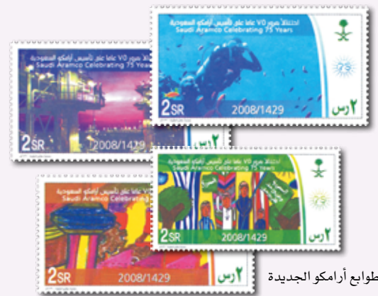
طوابع أرامكو الجديدة