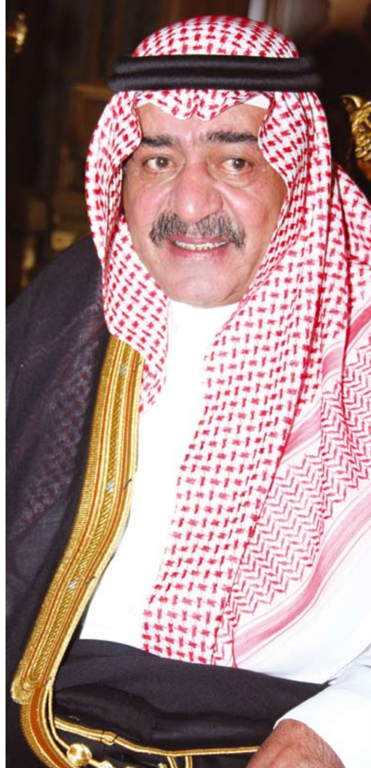
الأمير مقرن: المطلوب نشر الثقافة التقنية

وفي نهاية الحفل عبر معالي رئيس مؤسسة البريد السعودي، د. محمد صالح بن طاهر بنتن عن اعتزازه وتقديره برائد الثقافة الرقمية صاحب السمو الملكي الأمير مقرن بن عبدالعزيز، رئيس الاستخبارات العامة، منوهاً بجهوده في حقل تعميم استخدامات الحكومة الإلكترونية، ونشر الوعي الإلكتروني في القطاع الحكومي.