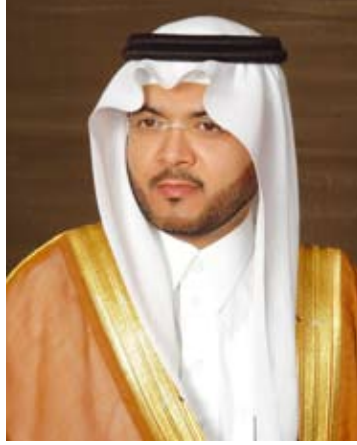
د. أسامة ألفت

اجتمع د. أسامة بن محمد ألفت، نائب رئيس البريد السعودي، مؤخراً، في العاصمة الإيطالية روما مع رئيس البريد الإيطالي ماسيمو سارمي، وكبار المسؤولين في البريد الإيطالي، بدعوة من البريد الإيطالي، لأجل التباحث في سبل التعاون المشترك في مجال تقنية المعلومات والجودة، وتقديم خدمات جديدة، والتعاون الاستراتيجي بين البريد الإيطالي والبريد السعودي. وتأتي الدعوة الإيطالية للتعاون المشترك بين الجانبين، بعد اطلاع المسؤولين في البريد الإيطالي على منجزات البريد السعودي، واعتماديته على التقنيات الحديثة، في أثناء مشاركة الجانب الإيطالي في المؤتمر الدولي للتقنيات المعلوماتية والبريدية، والذي احتضنته جدة نوفمبر الماضي.